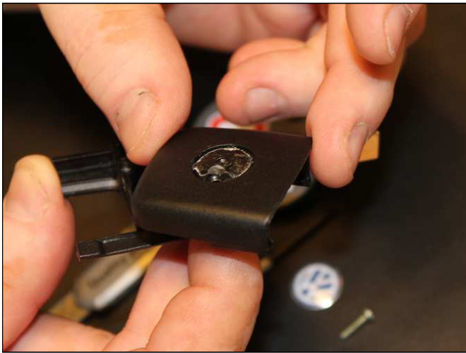
...tills den gått ca 1 varv och fjädern inte längre spänner.