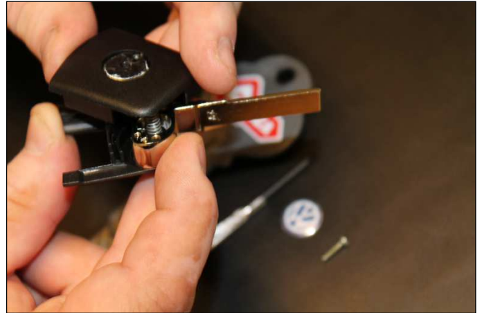
Släpp försiktigt och kontrollerat runt ena halvan...