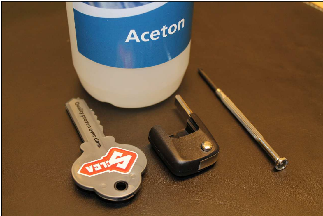
Användbara verktyg är Aceton, vass kniv, finmejsel-set, och snabblim.

Här följer en instruktion med tips för hur man kan gå till väga med nyckeln.