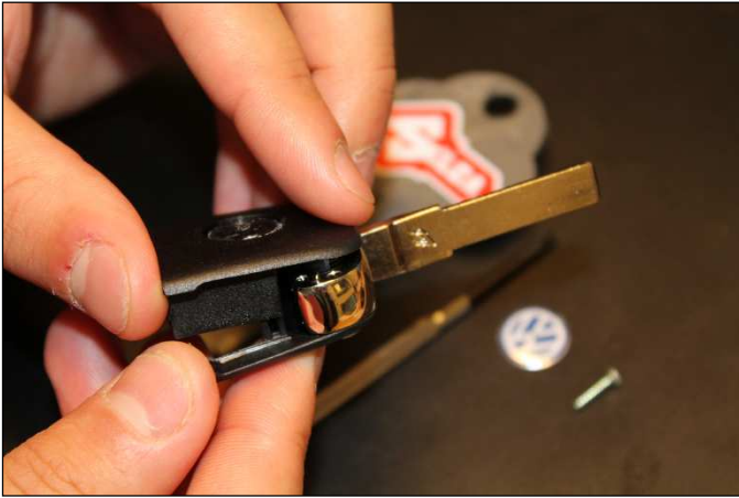
Låt inte fjädern sprätta iväg!

Håll i båda halvorna när nyckeln öppnas, så att de inte sprätter isär. Låt sen den ena halvan av greppet rotera ett varv så går förspänningen i fjädern ur. Var observant på just nämnda manöver, för när nyckeln ska monteras ihop igen gör du samma manöver i omvänd ordning, och kontrollera omedelbart därefter att bladet fjädrar åt rätt håll.