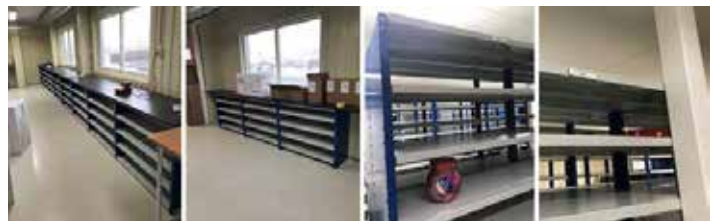
En megalång utställningsbänk och en mer moderat för manuella maskiner är på plats. Här kommer du att kunna se och prova alla modeller. Så var det den lilla detaljen att allt gods ryms på den hyllindelning vi gjort... UTOM Kevronburkarna! Så det var bara att göra om och göra rätt, hela 5 hyllsektioner fick byggas om. Och för att man lätt ska kunna manövrera lagret och snabbt hitta till rätt hylla, får varje sektion och hyllplan en adress.