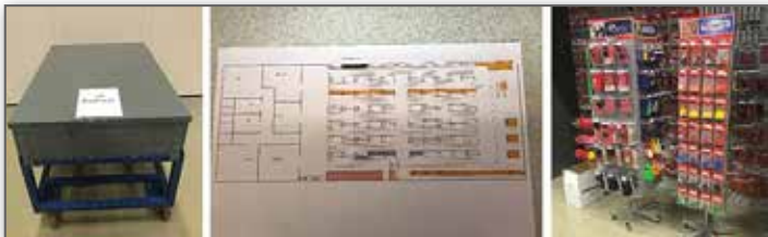
Transportvagnar som klarar även dom tyngsta maskinerna på 90 kg som Prima laser blir byggda i Eskilstuna, lager och kontorlayouten börjar sätta sig och några demoställ med tillbehör står färdiga för transport till Spydeberg, Norge.