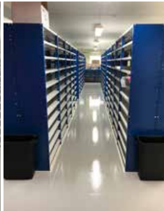
Från tomma lagerplatser...