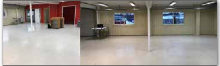
Lokalen är under iordningsställande, skyltar är på plats, ny fin inredning kommer i slutet på Januari och vi planerar start i April/Maj. 12000 produkter kommer vi att hantera från detta lager, varav 8000 blir lagerhållna från start.