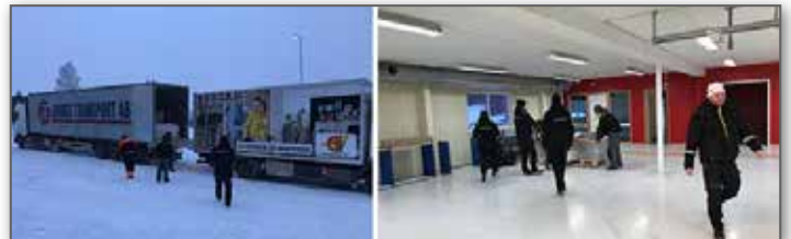
En fullastad trailer och ett helt team anländer med kontor och lagerinredning för iordningställande.