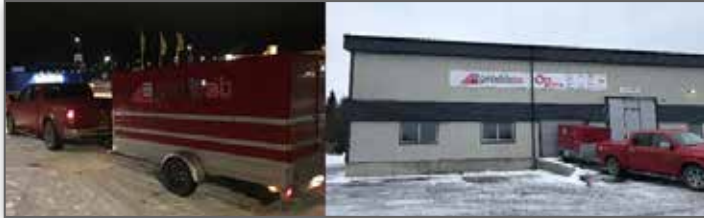
Här går första turen över till Norge med grejor från centrallagret i Sverige, dagarna före jul.

Att starta ett nytt företag, i ett annat land, om så bara grannlandet, kräver en hel del förberedelser OCH jobb! Man ska registrera ett företag, ha en lokal, personal, affärssystem, datorer, skrivare, hyllor, kontor, nåt att sälja osv osv ända ner till gem och kaffemuggar! Så MÅNGA resor till grannlandet har det blivit, men vad gör man inte för att göra det BÄSTA å la PRODIB STYLE!