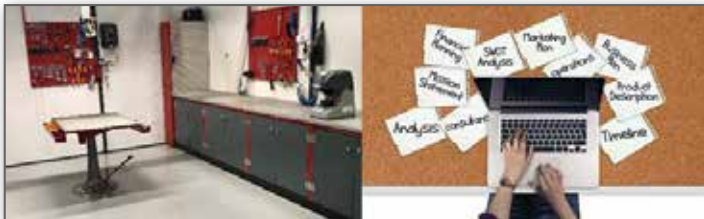
Kompletterande till lagret bygger vi en ny toppmodern verkstad för nyckelmaskiner, en kopia på den vi har i Sverige, så du kan känna dig trygg om du köpt en nyckelmaskin från oss, även i framtiden. Ett nytt datasystem som är sammankopplat med vårt större centrallager i Sverige är beställt och håller nu på att sättas upp.