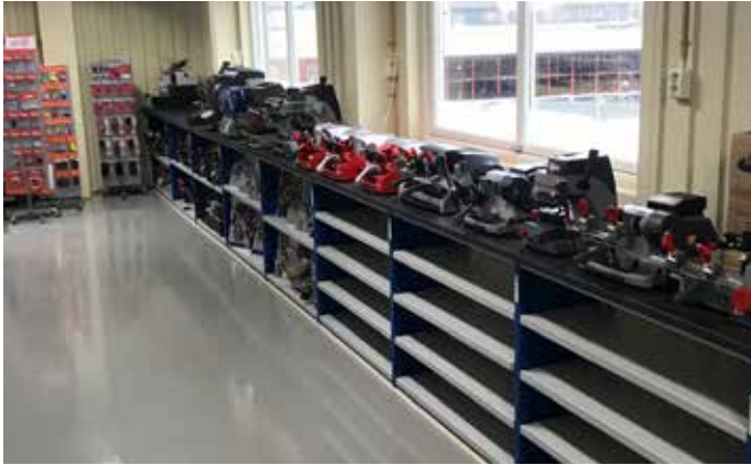
Utställningsmaskinerna och ställen med LockPro/Certegoförpackningar är på plats, likaså artkeyställen.