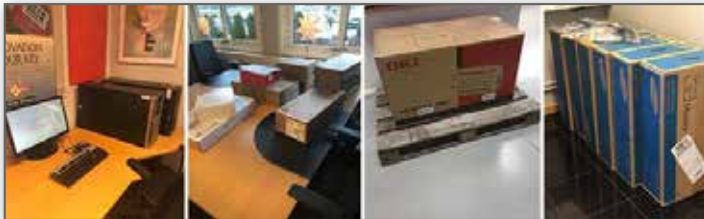
2 nya servrar uppstartade, datorer, skrivare är inköpta, nu ska vi bara provköra allt live i Eskilstuna innan vi kör igång i Norge och Prodib AS.