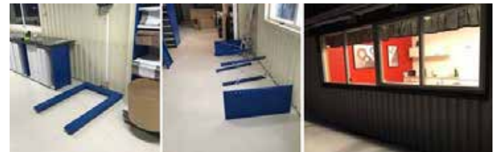
Pallvägen är monterad och på plats. Specialkapade hyllor för att få in så mycket ljus som möjligt från fönstren, tog extra tid. En titt genom fönstret i köket från utsidan.