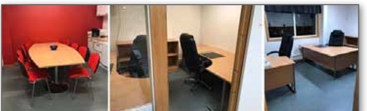
Köket har fått bord och stolar och det mesta av köksinredningen är på plats och två kontor har fått sin inredning. Snart är det bara personalen kvar.