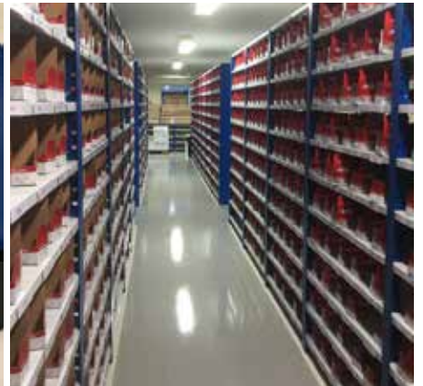
Till fulla hyllor! Alla nyckelämnena på plats, med rätt lagerplats för att snabbt och enkelt kunna plockas och skickas.