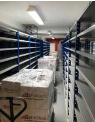
Många pallar blir det som ska plockas upp på de tomma hyllorna, och innan det måste alla lådor som godset ska ligga i plockas upp - många lådor blir det också...